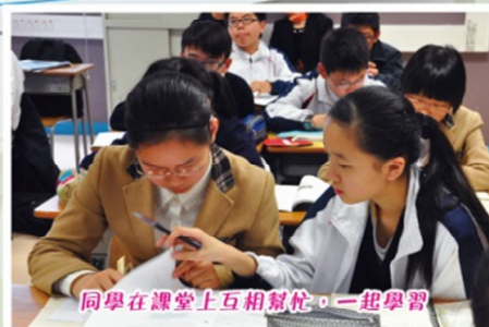
同學在課堂上互相幫忙，一起學習