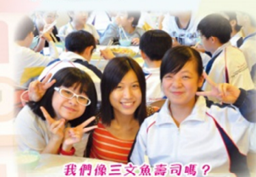
我們像三文魚壽司嗎？

同學看到我旅行日的打扮，都不禁想起三文魚刺身，也好，就做片肥美的三文魚刺身，跟飯糰黏在一起吧（「飯糰」在哪？請看圖。）！