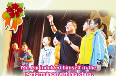
Mr. Lui indulged himself in the performance with his class.