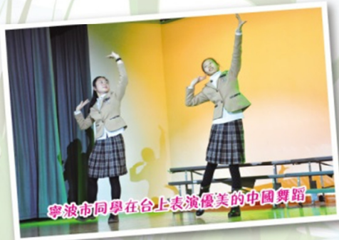
寧波市同學在台上表演優美的中國舞蹈

我十分感謝寧波市的同學，他們使我在說普通話的時候，自信心增添了不少，亦為自己可以在香港輕鬆的學習環境中學習，感到高興。