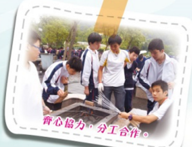
齊心協力，分工合作。