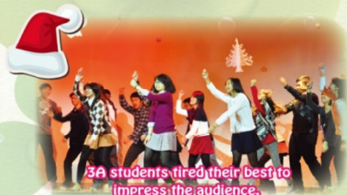
3A students tired their best to impress the audience.