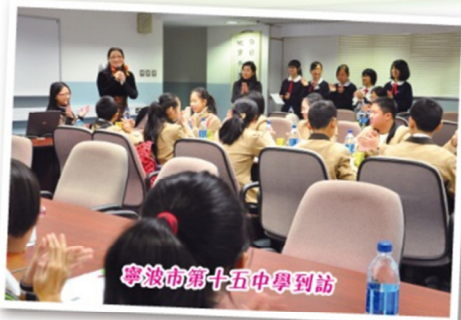
寧波市第十五中學到訪

透過這次的交流，我體會到內地的教育水平比香港的還要高。此外，我覺得內地的同學都很和藹可親、樂於助人，在他們身上，我學會了包容和諒解。