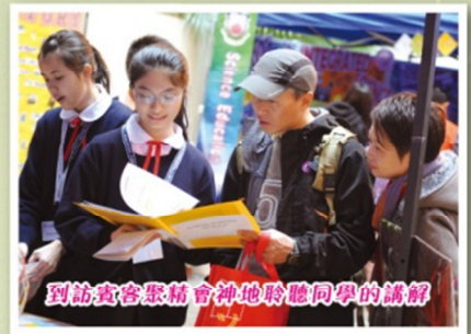
到訪賓客聚精會神地聆聽同學的講解

資訊日當天，學校於校舍地下停車場設不同學習領域的攤位區域，開放予入場人士參觀，展出的學習領域攤位包括中國語文教育、英國語文教育、數學教育、科學教育、科技教育、藝術教育、個人、社會及人文教育，介紹各科目的課程特色及資訊，又展示了學生的學習成果。參觀人士對學生的作品均給予高度評價，讚不絕口。除了展覽攤位外，學校更設有學校資訊站，以解答各參觀人士對學校入學的查詢。另外，來賓更可欣賞學生精彩的表演，包括合唱團、中國舞、樂器演奏等。