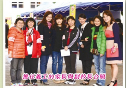
擔任義工的家長與副校長合照

學校資訊日於下午四時半圓滿結束，蒞臨參觀的賓客眾多，校園內人潮絡繹不絕、氣氛非常熱鬧。