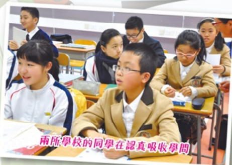
兩所學校的同學在認真吸收學問