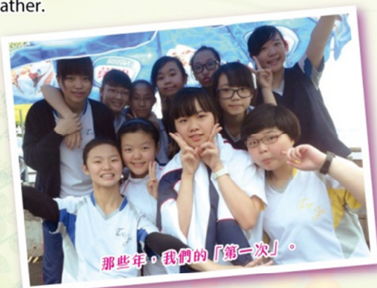
那些年，我們的「第一次」。

The school picnic was held on 30th November. Although it was rainy and cold, it didn't dampen the excitement and the enthusiasm of the students. This was a time for students to show patience and endurance while they waited for the food to be barbecued and ready to eat. They remained in good spirits from start to finish. They took some lovely photos to ensure they would not forget the day they had enjoyed so much with their classmates and teachers despite the damp weather.