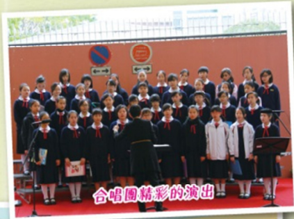
合唱團精彩的演出

為了讓教育同工、家長、學生及公眾人士深入了解保良局唐乃勤初中書院的辦學特色，以及與保良局莊啟程預科書院結籠的安排，本校於二零一二年十二月八日（星期六）舉行學校資訊日。