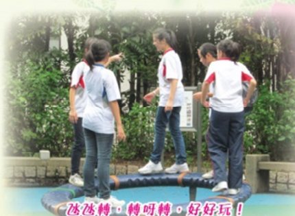
滋滋轉，轉呀轉，好好玩！