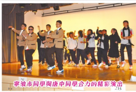
寧波市同學與唐中同學合力的精彩演出