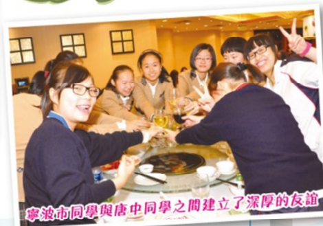
寧波市同學與唐中同學之間建立了深厚的友誼