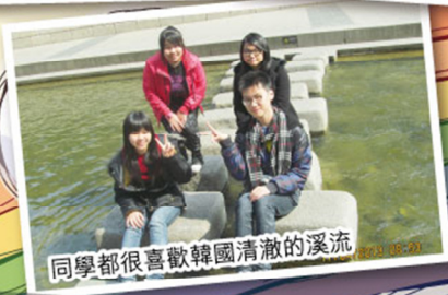
同學都很喜歡韓國清澈的溪流