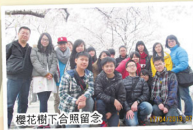
櫻花樹下合照留念

能在數百名候選人當中脫穎而出，我很開心，有機會參加學校舉辦的韓國考察團，這真是個寶貴的學習機會。這是一個為期五天的考察團，我們除了到首爾考察外，還去到了濟州島。短短數天，我們參觀了韓國很多的著名景點，例如：明洞、天地淵瀑布等。最印象深刻的是參觀在濟州最出名的風景勝地 - 城山日出峰和龍頭岩。登上了城山日出峰的山頂，可以飽覽城山日出峰的全景。這次的韓國考察團，使我們眼界大開之餘，也讓我們對韓國人民的文化、生活習慣、飲食禮儀等都有深入的了解。此外，我們還學到了不少的韓文，吃到了很多韓國地道的菜式呢！