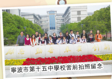
寧波市第十五中學校舍前拍照留念

時光飛逝，轉眼便到了離別之際，同學們紛紛送上自己精心設計的小禮物，互相交換聯絡方式，彼此已結下了深厚的友誼。離開寧波時，我們對十五中學的同學還有絲絲不捨之情，但我深信，大家所建立的友誼將會永存。