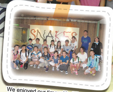
We enjoyed our time with different animals in Singapore Zoo.