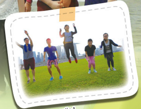
We are energetic!