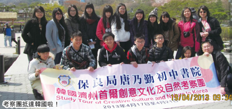
保良局唐乃勤初中書院 韓國濟州首爾創意文化及自然考察團

為期五天的韓國考察團，行程既緊湊又豐富，我很高興能夠與另外兩位同事一同帶領十五位同學到韓國考察，與大家渡過了許多歡樂時光。記得當時正是北韓領袖向外宣戰的時候，大家都很擔心自身安全。不過，相信大家最後也是樂而忘返的！在今次的考察團中，我們能認識到得許多韓國不同的文化和禮儀。在眾多行程令我最深刻的就是登上城山日出峰。雖然路上有優美的景色，但長途的山路曾令我多次想放棄登上高峰。不過慶幸我沒有輕易放棄，最後才能欣賞到令人拍案叫絕的景色！韓國的美食美景都令人留戀，希望不久將來能再有機會到韓國繼續精彩的旅程！