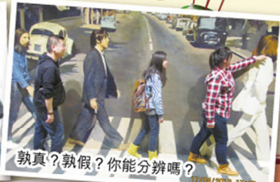
孰真？孰假？你能分辨嗎？