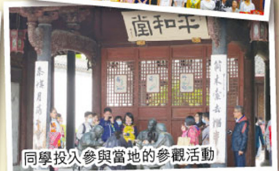
同學投入參與當地的參觀活動