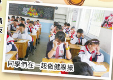
同學們在一起做健眼操