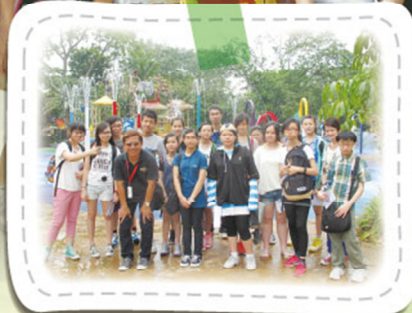
Let's get wet in the water park!